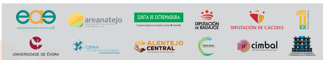
Matriz de logos de los socios